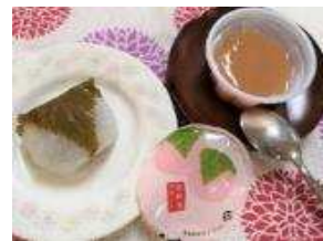
桜餅・お茶/コーヒー