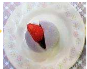
いちご大福・お茶/コーヒー