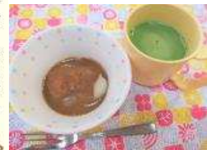
くるみ餅・抹茶ラテ